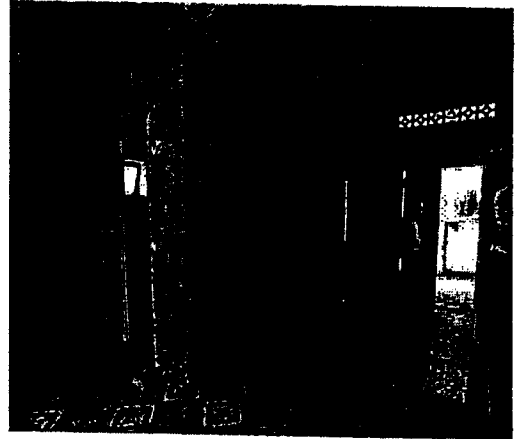
Hình 2: Nội thất công trình