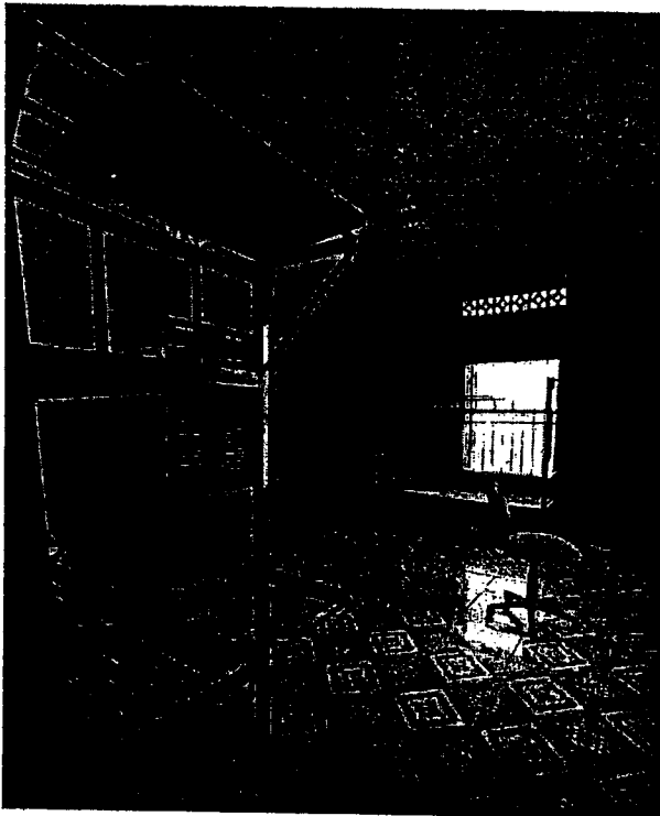
Hình 3: Trang thiết bị Nội thất phòng nghi