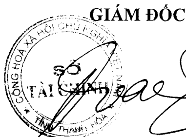
Đinh Cẩm Vân